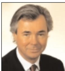
PIERRE S. PETTIGREW Ministro de Comercio Internacional de Canadá