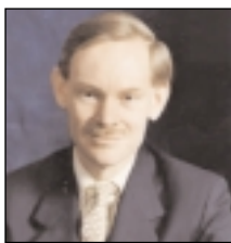
ROBERT B. ZOELICK Representante Comercial de EE.UU.