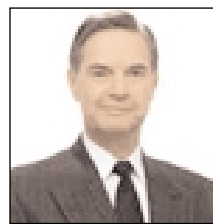
LUIS ERNESTO DERBEZ Secretario de Economía de México